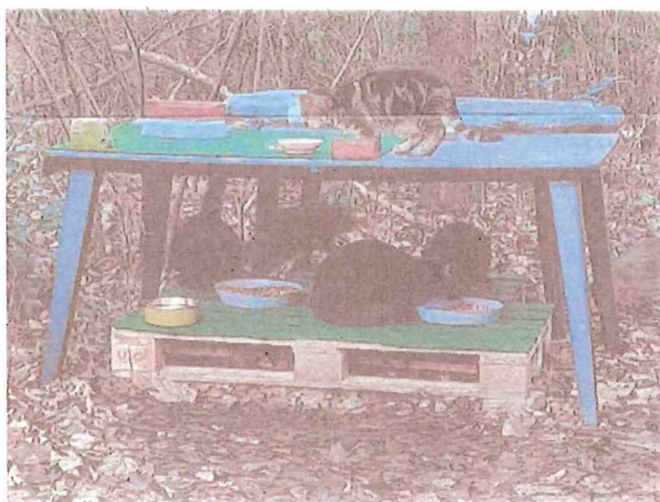
Kastrierte Streuner an einer kontrollierten Futterstelle

in Fallen eingefangen und kastrieren lassen.