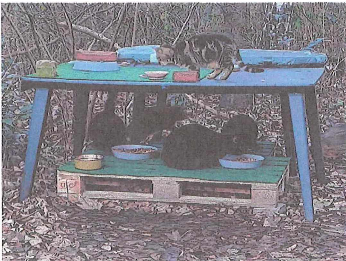
Kastrierte Streuner an einer kontrollierten Futterstelle

Alle wurden tierärztlich versorgt, kastriert und gekennzeichnet und an die Futterstellen zurückgesetzt. Hier dürfen sie leben und werden weiterhin von uns versorgt.