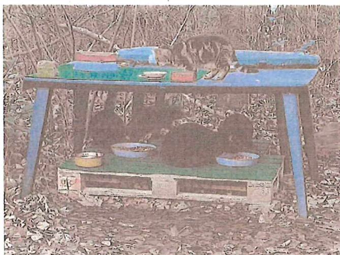
Kastrierte Streuner an einer kontrollierten Futterstelle

in Fallen eingefangen und kastrieren lassen.