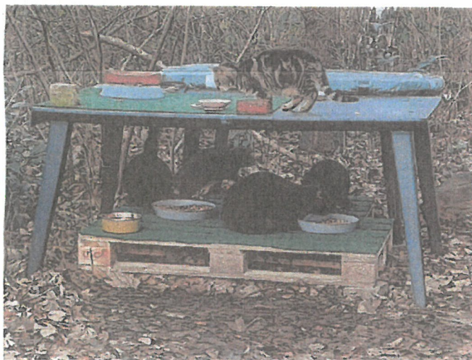
Kastrierte Streuner an einer kontrollierten Futterstelle

in Fallen eingefangen und kastrieren lassen.