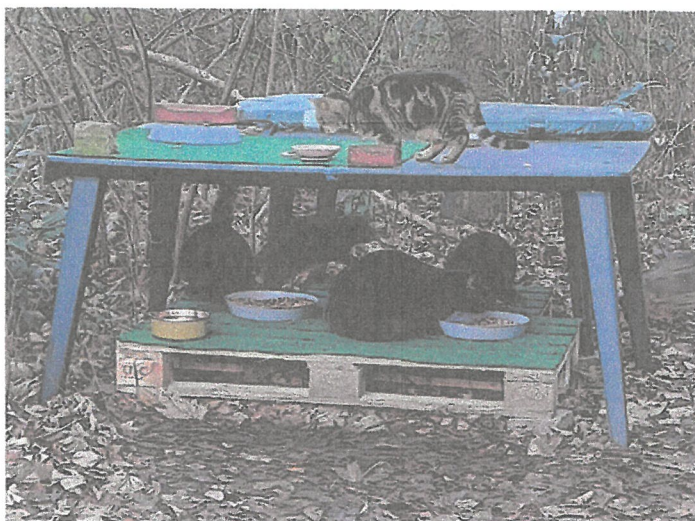
Kastrierte Streuner an einer kontrollierten Futterstelle

in Fallen eingefangen und kastrieren lassen.