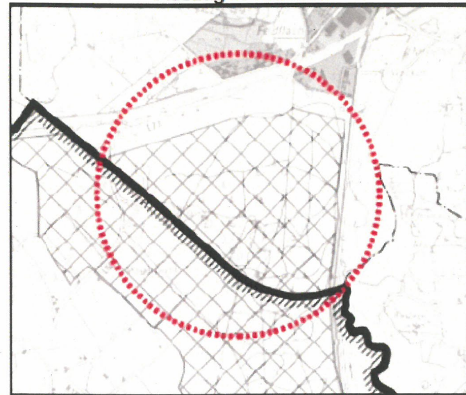
*Auszug 2. Entwurf*